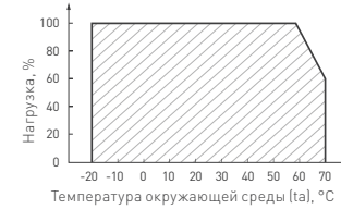
Рис. 4. Максимальная допустимая нагрузка, % от мощности источника