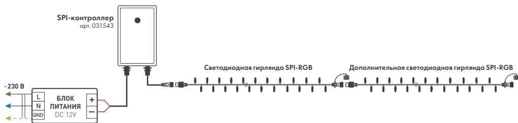
Рисунок 1. Схема подключения светодиодных гирлянд суммарной мощностью не более 80 Вт

3.5. Подключите источник питания к сети AC 230 В и проверьте работу контроллера во всех режимах работы.