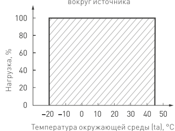
Рис. 5. Максимальная допустимая нагрузка, % от мощности источника