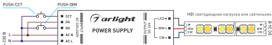
Рис. 2. Пример подключения функции PUSH DIM, PUSH CCT

Для блоков питания, не имеющих отдельного выхода CCT реализация функции PUSH CCT выполняется применением ограничивающего диода типа 1N4004 (см. рис. 3).